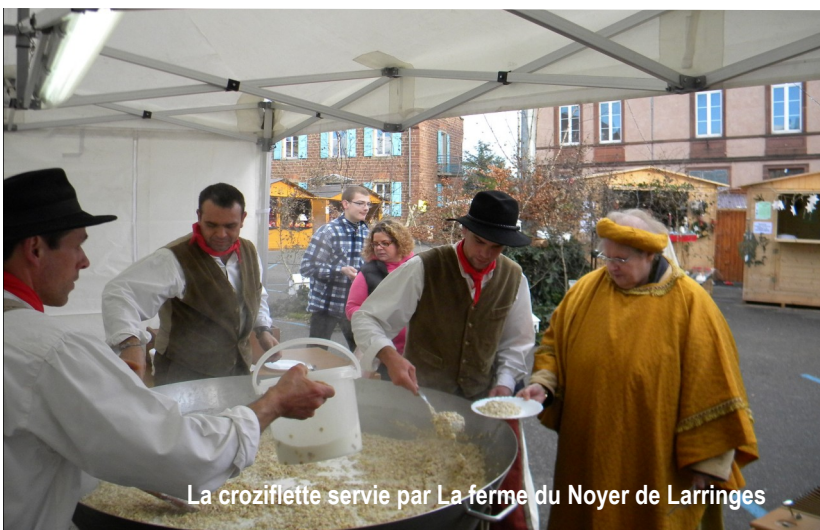
La croziflette servie par La ferme du Noyer de Larringes

Samedi 7 et dimanche 8 décembre le Comité de jumelage de Sciez était présent sur le marché de Noël de Wasselonne. Une belle occasion de promouvoir le village de Sciez, notre région et ses produits. Ce marché, qui depuis trois ans se veut médiéval, est composé d'une quarantaine de chalets et d'exposants.